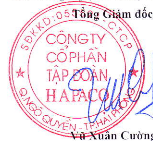
Vũ Xuân Cường